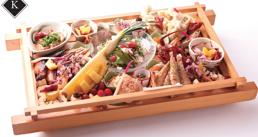
※写真は特選5人前です。