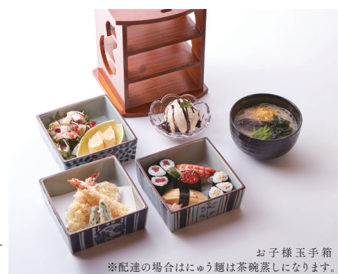
お子様玉手箱 ※配達の場合はこのように茶碗蒸しになります。

・だし巻 ・焼物 ・揚げ物 ・海老料理 ・和え物 ・鶏料理 ・煮物 ・フルーツ ・サラダ 他いろいろ